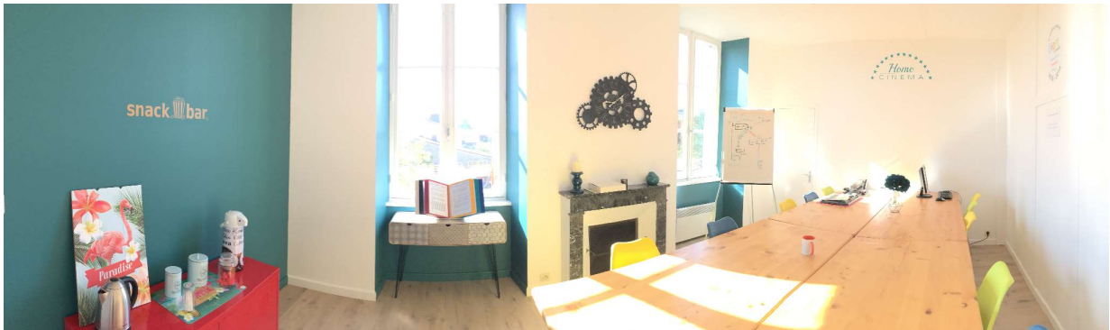
Salle Flexance à Cugand 85610

Parking gratuit devant le bâtiment, accès à la salle au 1er étage (non accessible pour les personnes à mobilité réduite) chez Flexane au 1 rue Jean Moulin 85610 Cugand (entre la médiathèque et l'église).