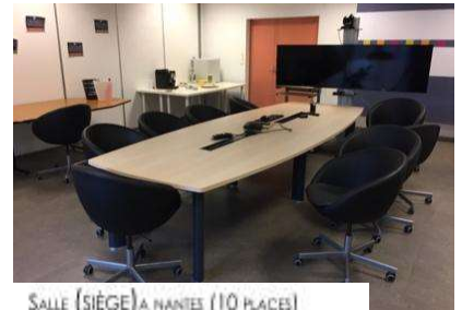
SALLE (SIÈGE) A NANTES (10 PLACES)